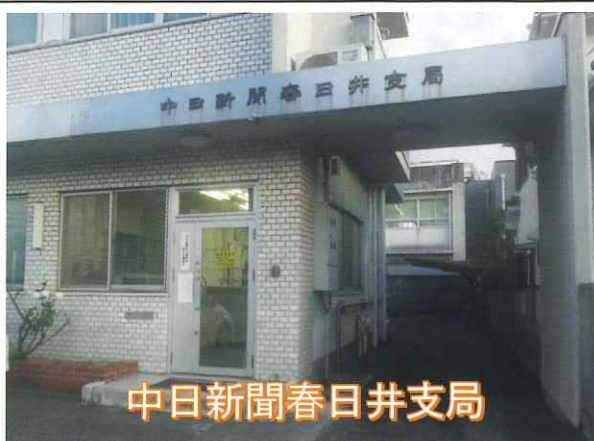
中日新聞春日井支局

令和元年十一月十三日台風十九号災害に対して中日新聞社事業団を通じて十萬円の義捐金を送りました。台風の被害にて被災された皆様には心よりお見舞い申し上げます。一日も早い復興とこれまで通りの日常を取り戻す事が出来ますよう祈念申し上げます。