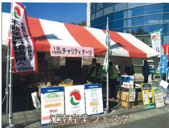
江南産業フェスタ

ーツをさせていただいて二日間の合計で一〇四人と多くの地域の方にご来場いただきました。