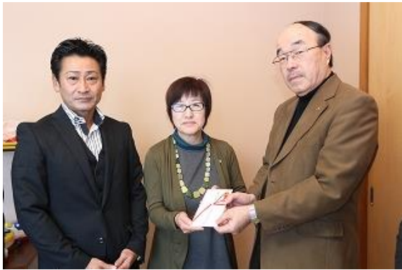
赤ちゃんの家さくらんぼさんへ15万円の寄付をさせていただきました。(2月2日)

視察で頂いた要望をもとに下記の通り寄付を行いました。この寄付に使われる費用は、各市民祭り会場や、支部企画研修会、県下統一研修会、ブロック懇談会などで会員の皆様や参加者の皆様に募金して頂いたものです。北尾張支部では、引き続き各病院や福祉施設へ、出来る限りの支援をおこなっていこうと考えています。そのためには皆様のご協力が欠かせません。ポケットに入っているワンコインで構いませんので、是非ご協力をよろしくお願いいたします。