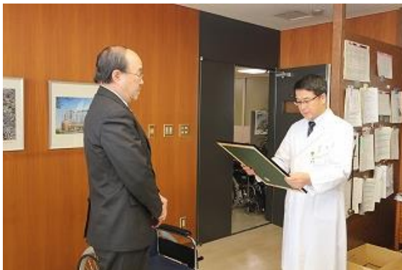
小牧市民病院さんへ車椅子5台を寄贈しました。(2月3日)